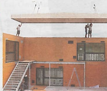
PopUp dorms: temporärer Wohnraum, 22. Bezirk. Entwickler: LANG consulting. Architekt: F2 ZT