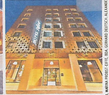
Hotel Schani beim Hauptbahnhof Wien. Entwickler: H5. Architekt: archisphere Gabriel Kacerovsky ZT