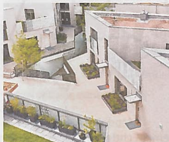
ODO lebt: Eine Fabrik im 16. Bezirk wurde zu Wohnraum. Entwickler: PRISMA. Architekt: querkraft zt