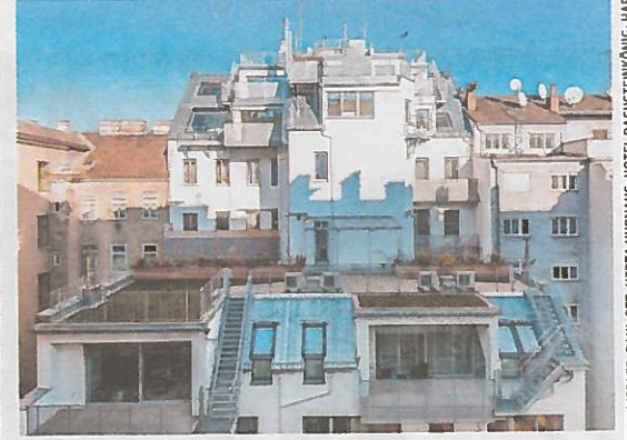
Belvedere 1030, Sanierung und Aufstockung. Projektentwickler: Gassner&Partner. Architekt: Atelier Kaindl+ Kuntner