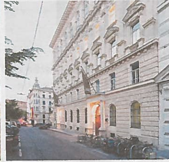
Telegraf 7 in Wien-Mariahilf. Büros in k. u. k. Telefonzentrale. Entwickler: Lehargasse 7. Architekt: BEHF