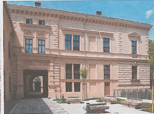
Restaurierung des Palais Löwenfeld & Hofmann. Entwickler: Linz Textil Holding. Architekt: Klinglmüller ZT