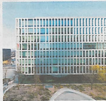
Bürohaus DENK DREI im 2. Bezirk. Entwickler: IC Development. Architekt: Atelier Chaix & Morel et Associés