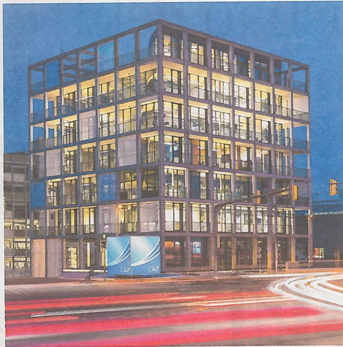
Bürohaus Brauquartier 2 in Graz, Headquarter für C&P Immobilien. Projektentwickler: C&P Immobilien AG. Architekt: INNOCAD architecture