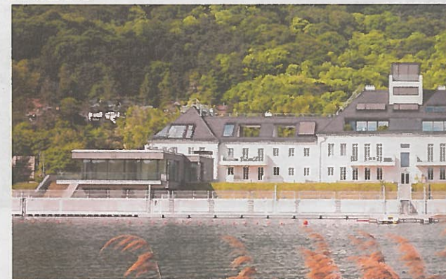
HAVIENNE appartements au bord. Die Marinekaserne Tegetthoff im umgebaut. Entwickler/Eigentümer: PBE Tegetthoff Projektentwicklu