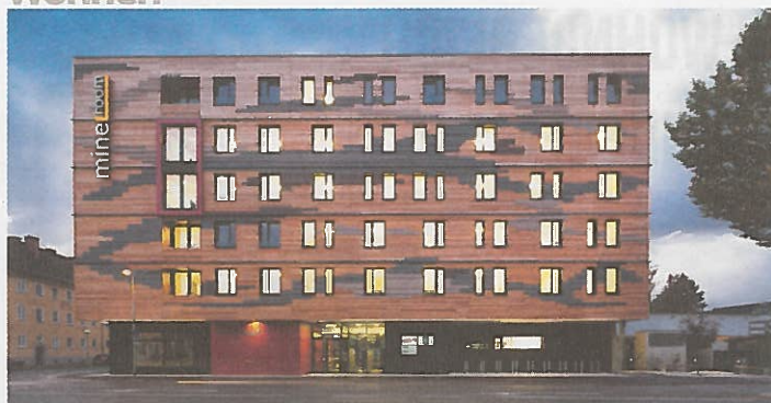
OeAD-Gästehaus mineroom Leoben, Passivhaus-Studentenheim in Holzbauweise. Entwickler: OeAD-Wohnraumverwaltung, Architekt: AP ZT