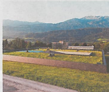
Sammlungs- und Forschungszentrum der Tiroler Landesmuseen in Hall. Entwickler/Architekt: Franz und Sue ZT