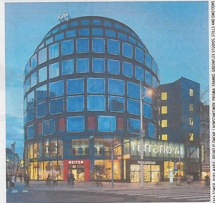
Stafa Tower Wien-Neubau wurde zu einem Hotel umgestaltet. Entwickler: Richard Schöps & Co. Architekt: BEHF Ebner Hasenauer Ferenczy ZT