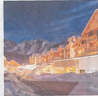
Kinderhotel Dachsteinkönig in Oberösterreich. Entwickler: Mayer Family Hotels. Architekt: Zeytinoglu ZT