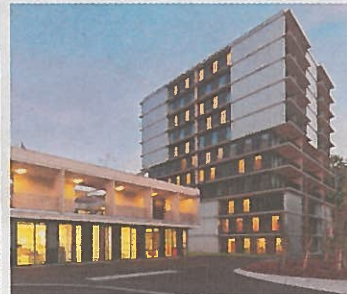
Sozialpastorales Zentrum St. Paulus Innsbruck. Entwickler: Neue Heimat Tirol. Architekt: marte.marte