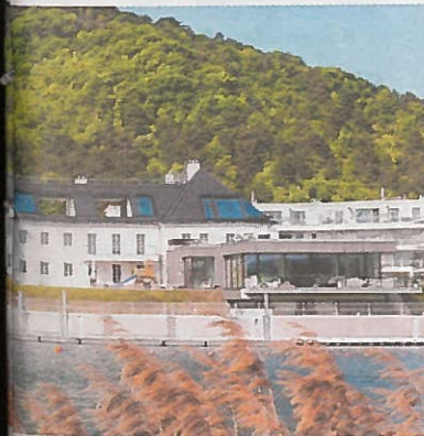
Bezirk wurden in Wohnraum Architekt: the sopht loft