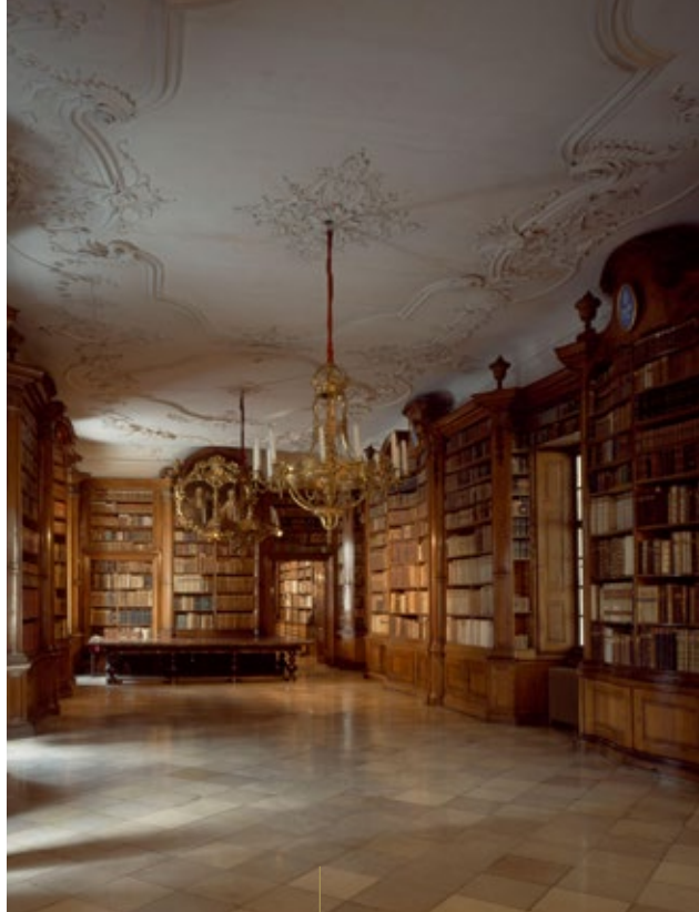
BIBLIOTHEK IM THERESIANUM