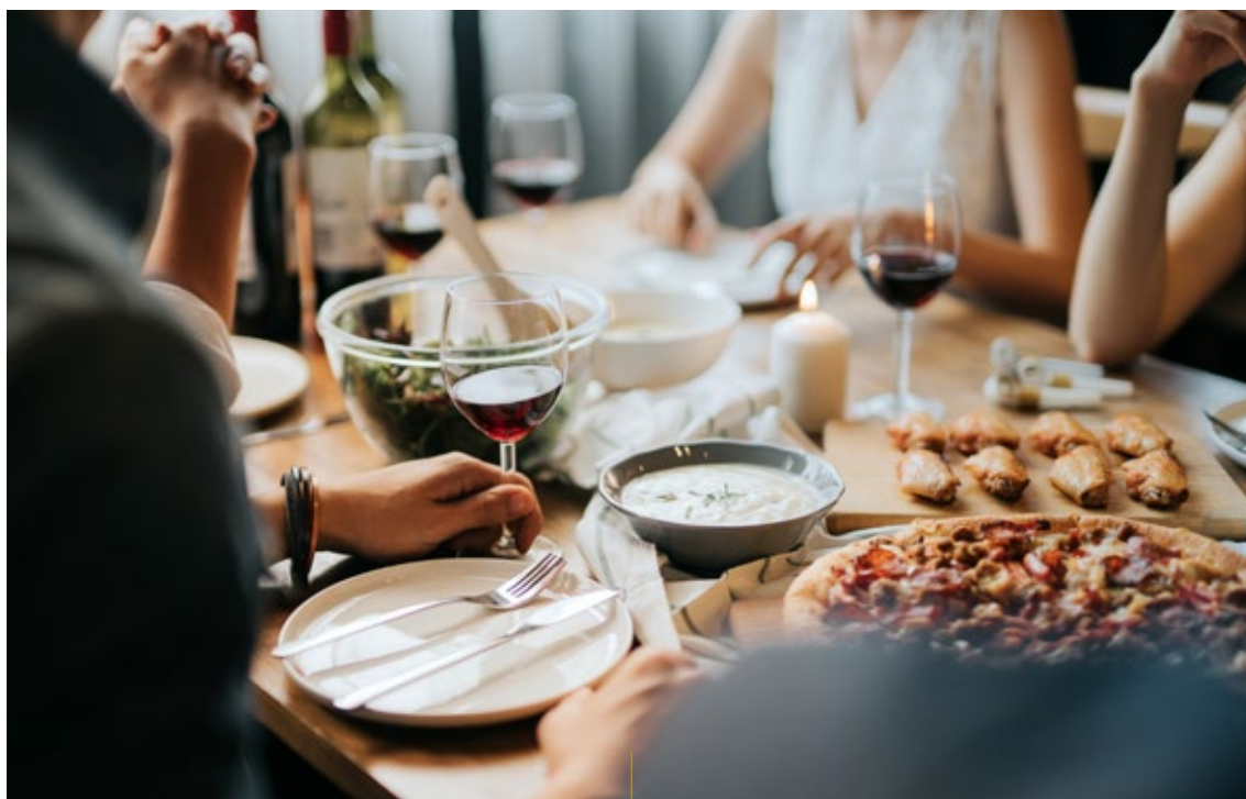
VIELFALT AN LOKALEN FÜR FEINSCHMECKER