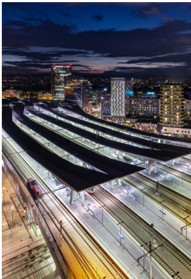
HAUPTBAHNHOF MIT BAHNHOF CITY