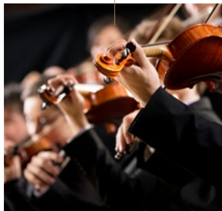
WIENER PHILHARMONIKER IM MUSIKVEREIN